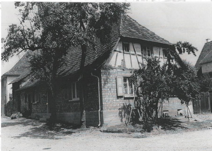
Erstes Schulhaus Ecke Ritter- und Thomasstraße

Ein Stall so zum gemeins Schulhaus gehört einst. (öckig) Vornen und hinten das obere kleine Roßtränk gässel, anderseit der pfarr garthen